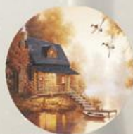
D 165 100x100 мм