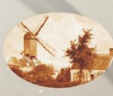
D 3 95x65 мм