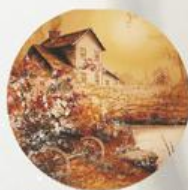
D 2 100x100 мм