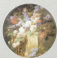
D 52 100x100 мм