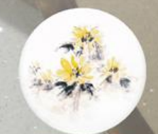
D 130 85x85 мм