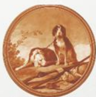
D 1 100x100 мм