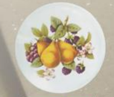
D 13 85x85 мм