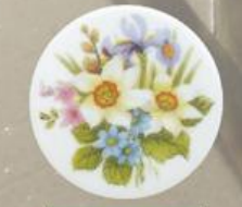
D 63 85x85 мм