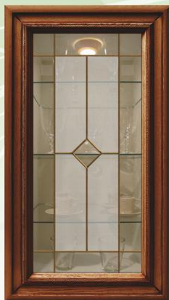
Сложный ромб внутренний