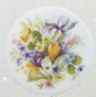
D 62 85x85 мм