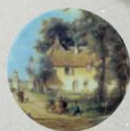
D 41 100x100 мм