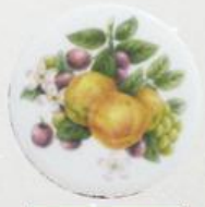
D 10 85x85 мм