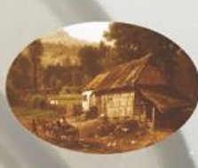
D 4 95x65 мм