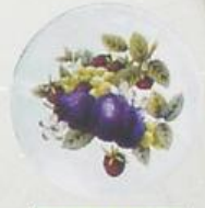
D 11 85x85 мм