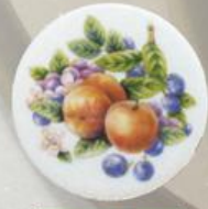
D 12 85x85 мм