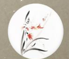
D 129 85x85 мм